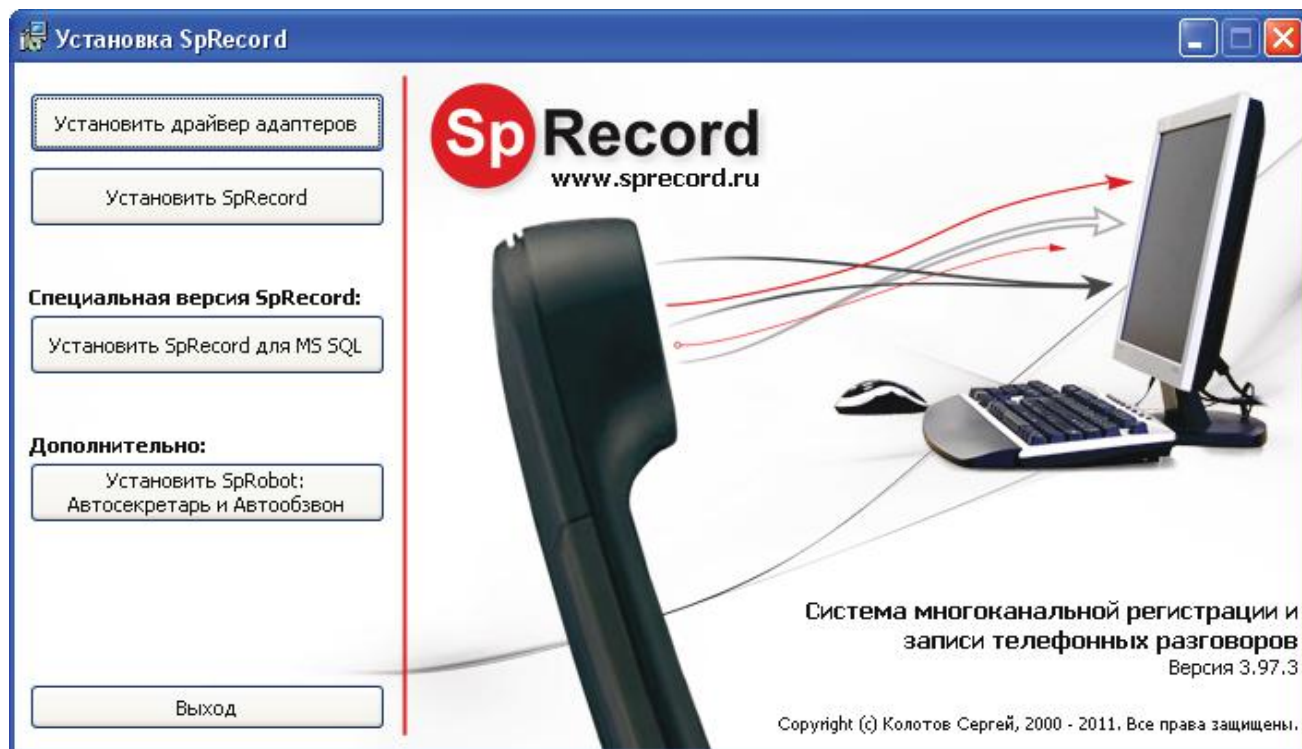
Рисунок 8.1. Установка драйвера адаптеров и программы SpRecord.

Для установки драйвера для адаптеров SpRecord вставьте компакт-диск в привод CD-ROM. Появится окно программы Установка SpRecord .